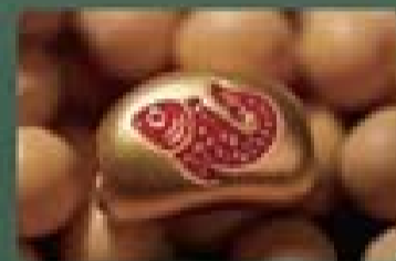
寓意财源广进，年年有余