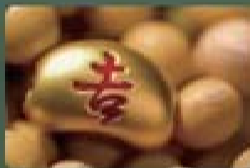
正财神于申时出生，其子为庚子年之“吉”