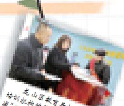
龙山区教育局加大对校外培训机构监管力度,推动“双减”工作落地见效。