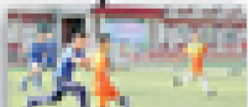
校园足球活动,不仅可以使学生增强体质,更能够锤炼意志,促进全面发展。