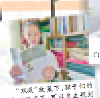
“双减”政策下,孩子们的课余时间多了,可以自主规划进行阅读等自学能力培养。