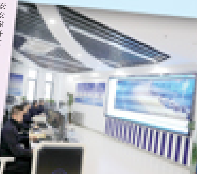
市公安局联合合作侦查中心针对电信网络诈骗犯罪发案形势,以防为先,践行训词精神,以实际行动为群众办实事。

“全民反诈”既是一项群众看得见、感受得到的惠民实事,又是一个长期议题。展开反诈宣传新攻势,构建协同作战新格局,最大限度挤压犯罪分子生存空间,从源头上预防和减少电信网络诈骗犯罪的发生,需要政府、企业、公众的联合参与,需要勇于创新与时俱进,妥善借助新科技和新平台力量,把握时代变化、解答时代难题。