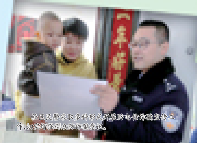
社区民警采取多种形式开展防电信诈骗宣传工作,切实提高群众防诈骗意识。