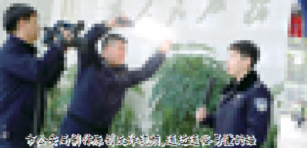
市公安局刑侦大队民警,通过典型案例讲解,宣传反诈知识,提高群众的防骗意识和能力。