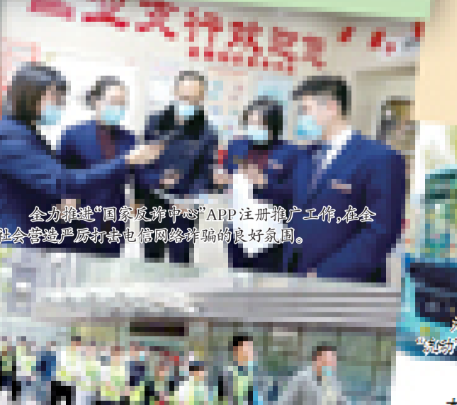
全力推进“国家反诈中心”APP注册推广工作,在社会营造严厉打击电信网络诈骗的良好氛围。