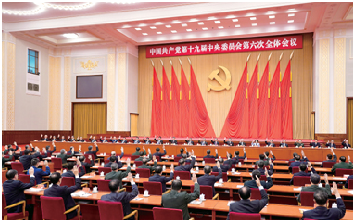
中国共产党第十九届中央委员会第六次全体会议,于2021年11月8日至11日在北京举行。中央政治局主持会议。

新华社北京11月11日电 中国共产党第十九届中央委员会第六次全体会议公报 (2021年11月11日中国共产党第十九届中央委员会第六次全体会议通过) 中国共产党第十九届中央委员会第六次全体会议,于2021年11月8日至11日在北京举行。出席这次全会的有,中央委员197人,候补中央委员151人。中央纪律检查委员会常务委员会委员和有关方面负责同志列席会议。党的十九大代表中部分基层同志和专家学者也列席会议。全会由中央政治局主持。中央委员会总书记习近平作了重要讲话。 全会听取和讨论了习近平受中央政治局委托作的工作报告,审议通过了《中共中央关于党的百年奋斗重大成就和历史经验的决议》,审议通过了《关于召开党的第二十次全国代表大会的决议》。习近平就《中共中央关于党的百年奋斗重大成就和历史经验的决议(讨论稿)》向全会作了说明。 全会充分肯定党的十九届五中全会以来中央政治局的工作。一致认为,一年来,世界百年未有之大变局和新冠肺炎疫情全球大流行交织影响,外部环境更趋复杂严峻,国内新冠肺炎疫情防控和经济社会发展各项任务极为繁重艰巨。中央政治局高举中国特色社会主义伟大旗帜,坚持以马克思列宁主义、毛泽东思想、邓小平理论、“三个代表”重要思想、科学发展观、习近平新时代中国特色社会主义思想为指导,全面贯彻党的十九大和十九届二中、三中、四中、五中全会精神,统筹推进国内国际两个大局,统筹推进疫情防控和经济社会发展,统筹发展和安全,坚持稳中求进工作总基调,全面贯彻新发展理念,加快构建新发展格局,经济保持较好发展态势,科技自立自强积极推进,改革开放不断深化,脱贫攻坚取得决定性胜利,民生保障有效改善,社会大局保持稳定,国防和军队现代化扎实推进,中国特色大国外交全面推进,党史学习教育扎实有效,战胜多种严重自然灾害,党和国家各项事业取得了新的重大成就。成功举办庆祝中国共产党成立100周年系列活动,中共中央总书记习近平发表重要讲话,正式宣布全面建成小康社会,激励全党全国各族人民意气风发踏上向第二个百年奋斗目标进军的新征程。 全会认为,总结党的百年奋斗重大成就和历史经验,是在建党百年历史条件下开启全面建设社会主义现代化国家新征程、在新时代坚持和发展中国特色社会主义的需要;是增强政治意识、