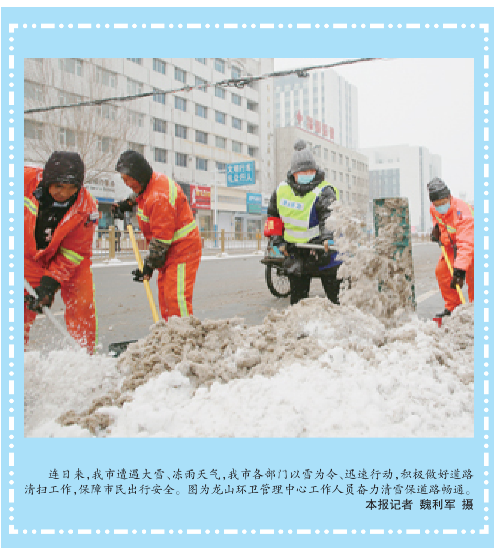
连日来,我市遭遇大雪、冻雨天气,我市各部门以雪为令,迅速行动,积极做好道路清扫工作,保障市民出行安全。图为龙山环卫管理中心工作人员奋力清雪保道路畅通。本报记者 魏利军 摄

清雪工作是一项群众性工作,每个市民都有责任和义务参与到清雪工作中来。在此,市清雪总指挥部呼吁各企事业单位、机关各部门充分发挥示范带动作用,自觉投身到清雪行动中,门店商户积极履行“门前五包”责任,做到“以雪为令、随下随清,雪中路通、雪停路畅”。