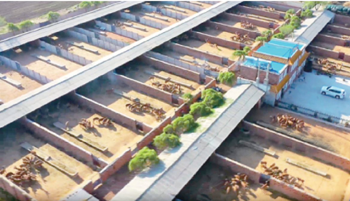
文福鹿场每年都会培育出大批具有东丰梅花鹿品系特点的优质梅花鹿。