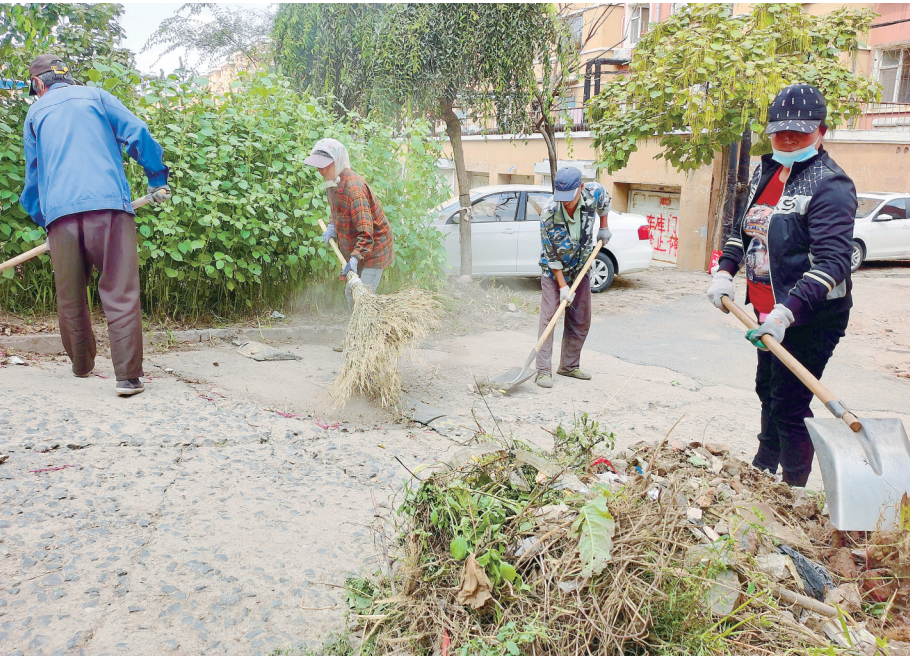
“创城”在行动 龙山区安盛物业不断推进居民小区精细化管理,创建高标准保洁小区,改善生活环境,提升百姓幸福感。

“今年暑伏,没闻到臭味!”“下雨回家,鞋没‘灌包!’”“停车有序,不再抢车位”……说起身边环境的变化,龙山区23个曾经的弃管小区居民喜笑颜开。 10月12日,记者在银河小区看到,龙山区安盛物业的工作人员对小区内垃圾、杂草、楼道进行清理保洁作业。物业现场负责人介绍说:“这只是我们每天工作的一个缩影。目前,与我们同步进行集中整治的小区还有银基花园、巨峰小区、盛世花园等23个居民小区。” 为确保“创城”工作扎实有效推进,不断提升居民生活幸福感,龙山区安盛物业结合“全国文明城市”创建内容及要求,认真排查各居民小区存在的问题,汇总整理形成《“创城”问题清单》及《“创城”问题整改台账》,针对难度大的点位及区域,进行集中整治,针对普遍存在的问题,进行拉网式清理整治。 据了解,自今年4月19日安盛物业成立以来,为23个居民小区摘掉了弃管小区的“帽子”,居民生活环境质量得到了极大提升。