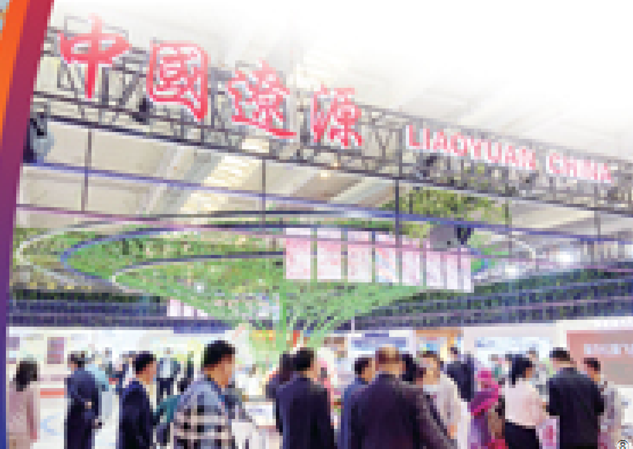
⑧ 第十三届中国—东北亚博览会辽源展馆外景。