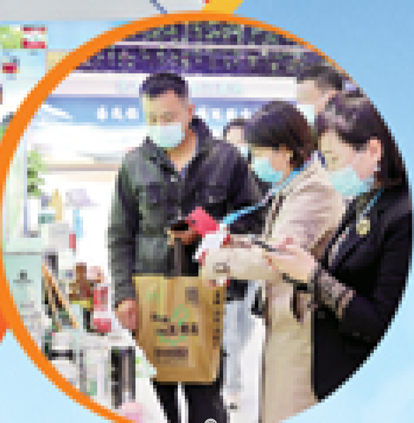
⑦ 参会嘉宾与工作人员进行交流。