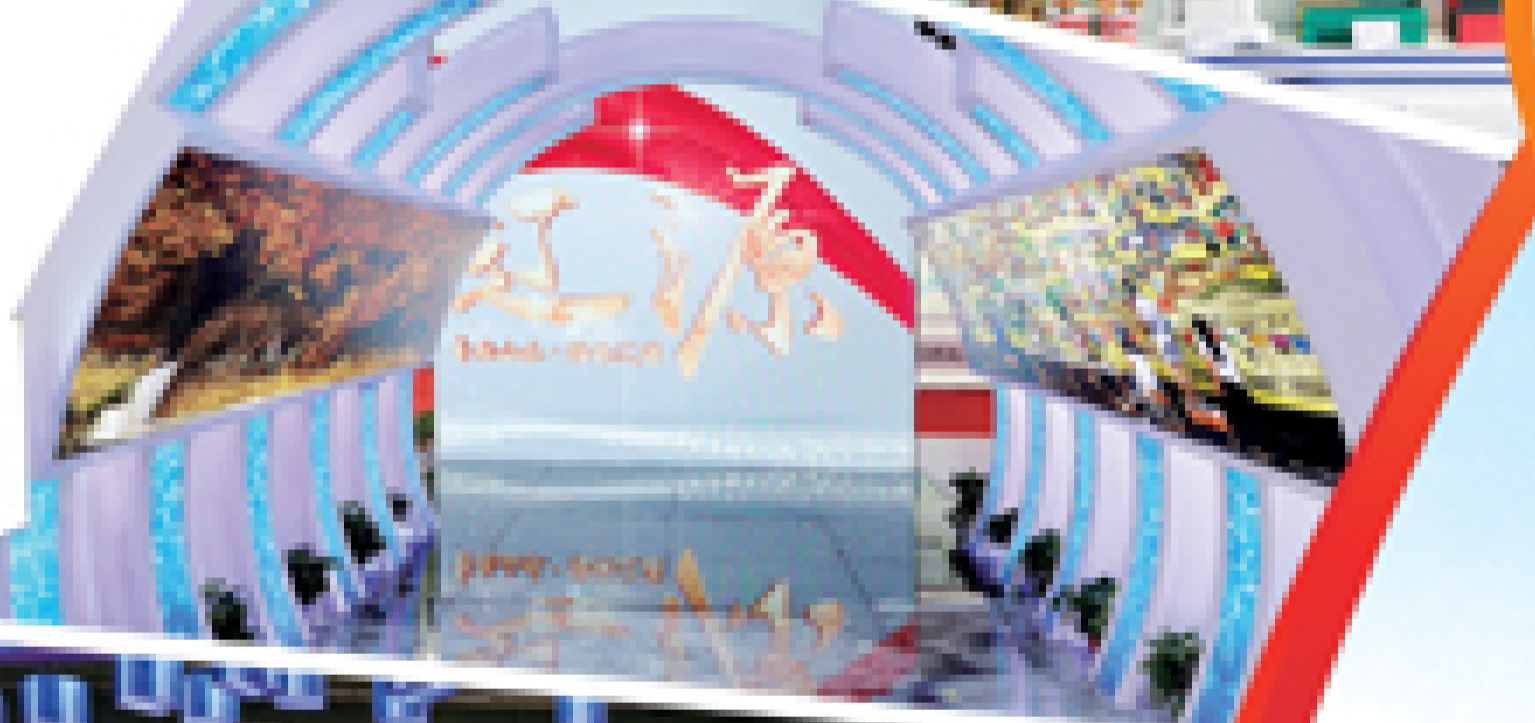
③ 灯光闪烁的“辽源风光走廊”匠心独具。