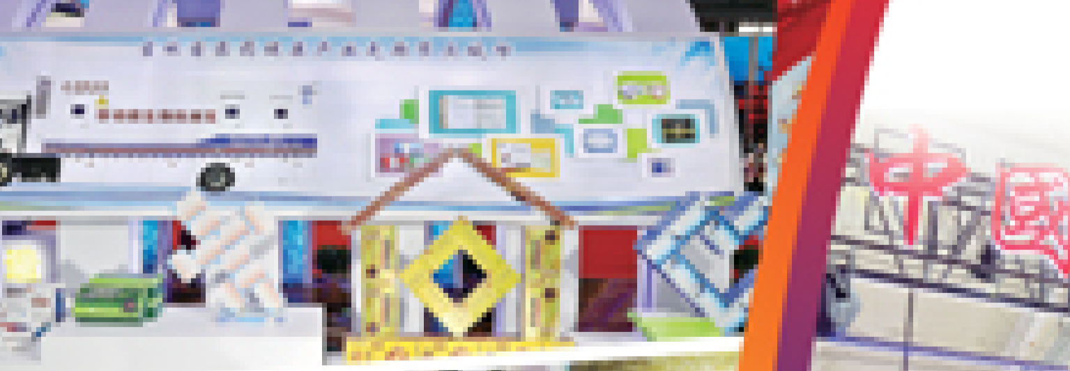
④ 我市企业参展产品别出心裁。