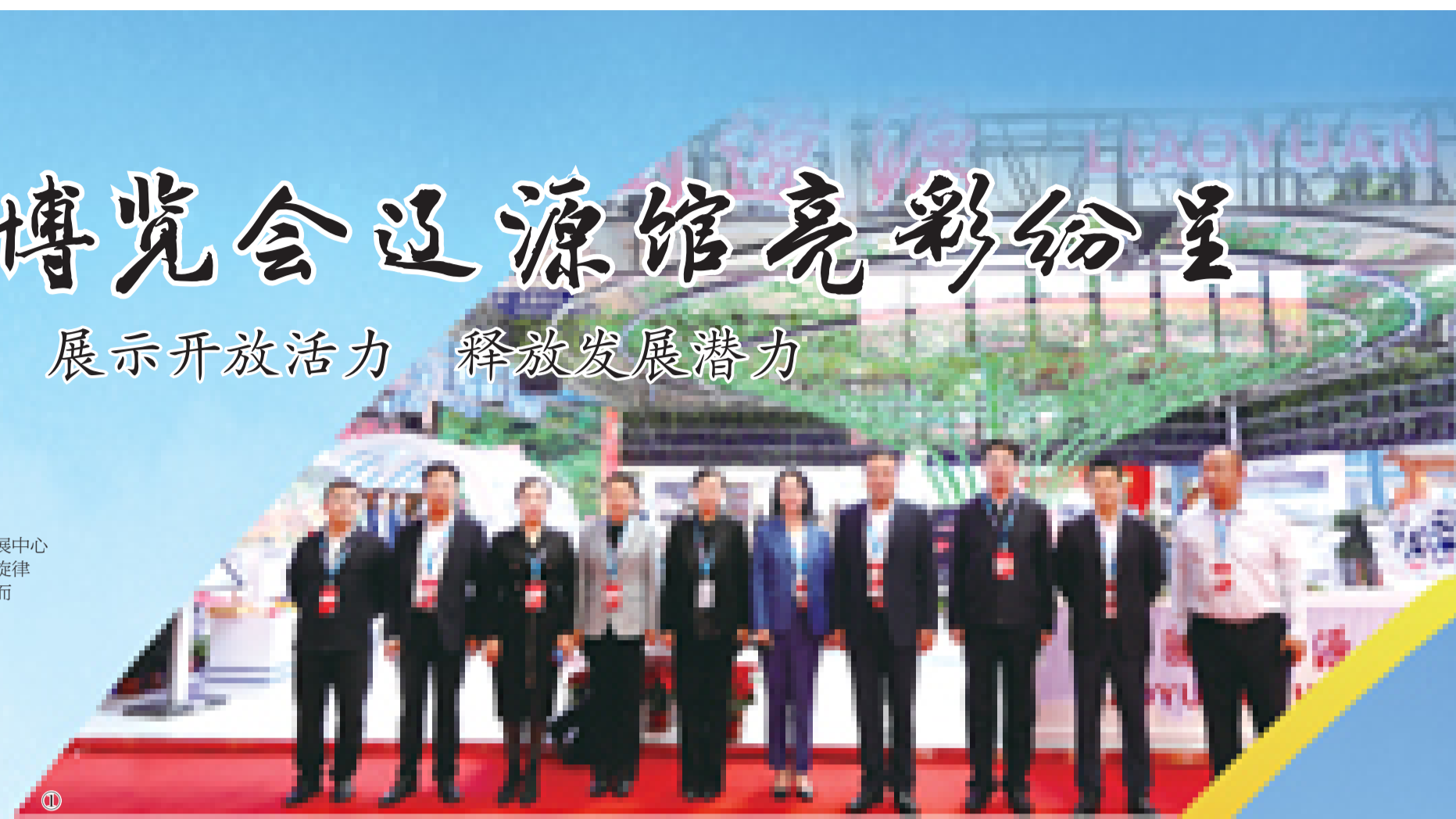
① 市领导同相关工作人员在第十三届东北亚博览会辽源展馆前合影留念。

各展区设计独具匠心,通过现代科技手段,突出辽源产业基础、时尚理念及发展方向,融入“中国袜业名城”“中国梅花鹿之乡”“中国琵琶之乡”等城市名片元素,融汇科技、智慧和时尚元素。展区在突出辽源特色、彰显城市包容之感的同时,还着重展示辽源经济建设成就、新兴产业、投资环境、招商引资项目及名特优产品等发展硕果,为众多客商呈现出一个充满特色魅力、开放活力、发展潜力的辽源形象。