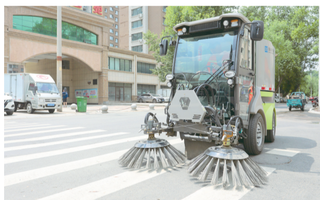
小型水洗吸尘车入驻居民小区周边开展环境卫生提升作业。

本报讯(记者 宋瀚)龙山区环境卫生管理中心自城市清洁行动开展以来,为全面提升辖区内环境卫生质量,给小区居民提供一个宜居宜业的生活环境,组织环卫工人对小区内主次干道、小区楼道、居民活动场地等进行彻底整治,让辖区“颜值”靓起来。