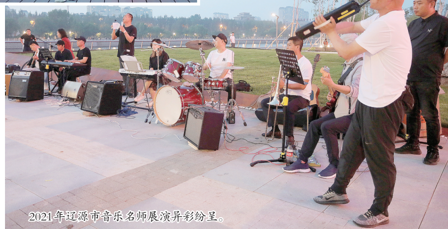
2021年辽源市音乐名师展演精彩纷呈。

为丰富群众文化生活、提升群众音乐鉴赏力和城市品位,助力“全国文明城市”创建,6月11日晚,由市文化广播电视和旅游局、市文学艺术界联合会主办,市文化馆、市艺术团有限责任公司承办的2021年辽源市音乐名师展演活动在东辽河畔拉开帷幕。