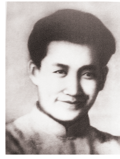
刘志丹像 新华社发