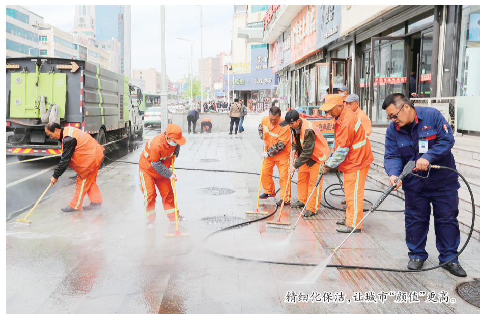
精细化保洁,让城市“颜值”更高。