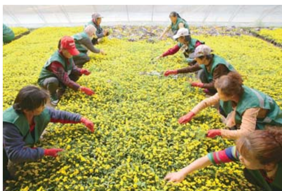
本版稿件由本报记者 于蕾 采写