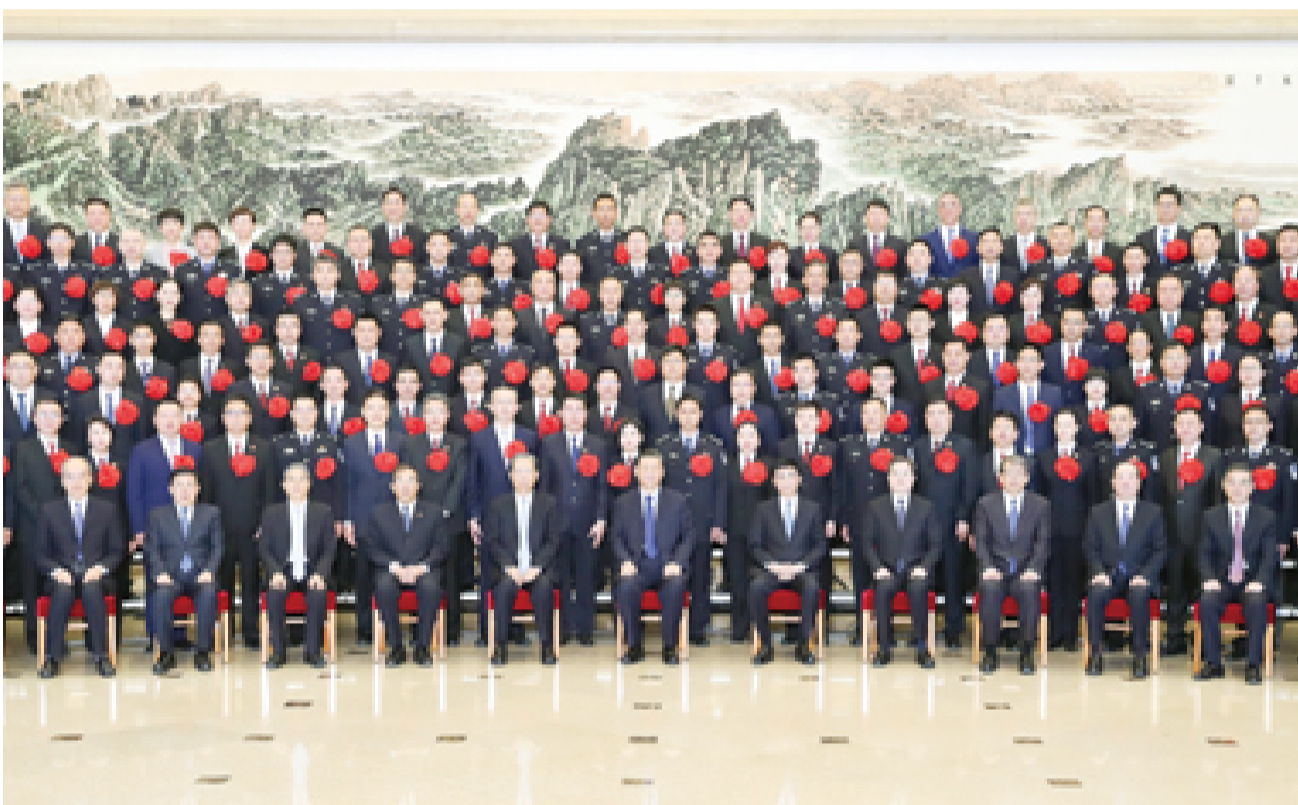
3月29日,党和国家领导人习近平、王沪宁、赵乐际等在北京会见全国扫黑除恶专项斗争总结表彰大会代表。