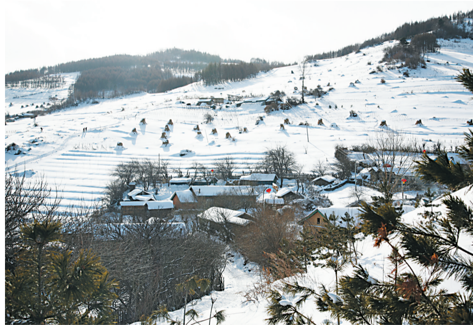
此次降雪过程对保墒护墒作用十分显著,利于我市春耕生产。

本报讯(记者 李及肃)春有百花秋有月,夏有凉风冬有雪。若无闲事挂心头,便是人间好时节。3月20日,正是春分时节,一场如意的雨雪如约而至。记者在气象局了解到,受高空低涡影响,20日4时我市出现雨雪天气。截至21日7时,全市平均降水量12.7毫米,市辖区降水量13.9毫米,东丰12.9毫米,东辽11.2毫米。