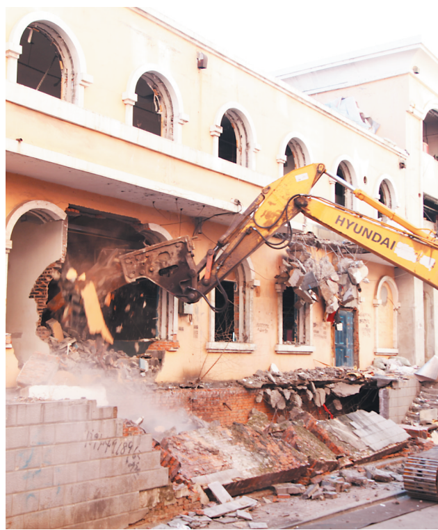
仙人河盖板楼拆除工作现场。