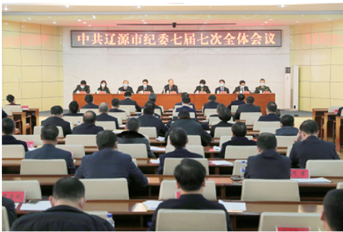
2月5日,中共辽源市第七届纪律检查委员会第七次全体会议召开。

柴伟强调,一要深刻把握全面从严治党政治性,不断提高政治判断力、政治领悟力、政治执行力。充分认识各类腐败问题的政治本质和政治危害,明辨是非,有效抵御风险挑战;坚持从政治上领会好、领会透党中央关于党风廉政建设和反腐败斗争的决策部署;对标对表