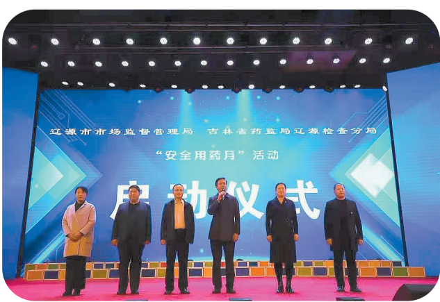
市市场监管局与吉林省药监局辽源检查分局举行2020年“安全用药月”启动仪式暨“药品安全进校园宣传日”活动