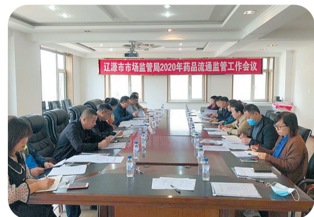
市市场监管局召开2020年药品流通监管工作会议