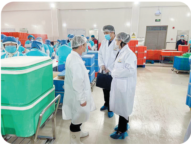
市市场监管局对大型配餐企业及学校食堂集中进行食品安全监督检查