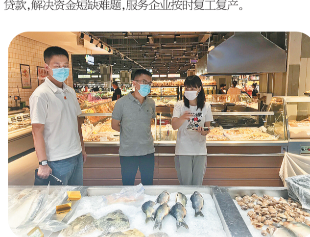
市场监管综合执法支队食品大队对聚餐包桌餐饮单位进行食品安全巡查

158件,融资26.8亿元;推进知识产权质押融资工作,格致汽车获得知识产权质押贷款1000万元。 深化食品药品安全监管。以保食品安全为目标,以提升监管水平为主线,有效防范系统性、区域性食品安全风险,抓好关键环节,落实两个责任。制定监管计划和《日常监管手册》,规范有序开展日常监督检查。开展肉品综合治理行动、农村食品安全专项整治、加强疫情期期间食品安全、节假日食品安全大检查等多个专项行动。进一步强化食用农产品销售监管,督促市场开办者和销售者落实主体责任。配合开展“菜篮子”稳产保供,稳步推进肉品质量安全整治,开展创建“放心肉菜示范超市”活动,推动食品销售风险分级管理工作,开展固体饮料等食品专项整治,加大保健品专项整治,推进“寻找笑脸就餐”活动和“明厨亮灶”建设。开展食品安全抽检工作,今年开展食品安全抽检706批次、学校食堂及配餐企业抽检41批次、“疫情”防控期间食品安全抽检33批次,查处不合格食品案件22件。全面加强冻鲜食品、冷链疫情防控监管,加强进口冷链食品追溯管理工作,对食品进口商、生产经营企业、食用农产品批发市场、商场超市、生鲜电商、餐饮企业等进行全面排查实现全覆盖备案。加强食品安全违法案件查处,严厉打击食品违法违规行为。组织开展全市食品安全考核和省食安办对我市食品安全考核,我市食品安全工作被评为A等级。加强药品监管,制定年度药品监管工作计划和工作要点,全力推进药品流通领域监管创新,建立了药店负责人主体责任监管等工作七项工作制度,实施网格化监管,完善《药品经营许可证》信息档案。组织召开全市大型医疗机构主体责任专项会议,对全市42家医疗机构相关负责人进行集体约谈。开展“安全用药、依法前行”和“用药安全月”宣传活动。试行《辽源市药品零售连锁企业推行“电子处方”和“执业药师远程审方”的实施意见》,制定全市《关于推进药品职业化检查员队伍建设的指导意见》,实行“AB角工作制”,消除监管“盲区”。开展创建“药品经营规范化管理示范店”活动,推广6家示范店,充分发挥优秀企业的示范引领作用,体现出我市药品监管探索“敢为人先”的创新精神。2020年,药品抽样320批次,医疗器械30批次、化妆品40个批次。 落实公平竞争审查制度,强化刚性约束。分批次开展医药、建筑、交通、招投标和政府采购、公章刻制等领域滥用行政权力,排除限制竞争行为执法检查。推进反不正当竞争执法,建立市政府重点工作任务和市局重点工作反不正当竞争工作目标责任制、施工图,明确时限,责任到人。加强直销监管,召开“约谈会”,开展打击传销“雷霆2020”专项行动和“三打一护”反不正当竞争执法工作。部署市场监管领域突出问题专项整治、“行业清源”攻坚行动,惩治乱象,提高违法成本。建立21个商业秘密保护服务站,推进建立商业秘密保护工作。保供稳价开展价格行政执法,组织开展民生价格监督检查,农资价格专项检查、转供电等专项检查。对全市企业经营汽车检测线的13户企业进行稳定价格提醒约谈,约谈企业和经营者及时制止发表涨价言论和串通涨价企图。