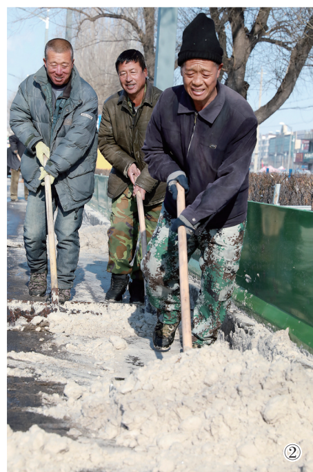
①园林:景观带、公园绿化带,实现步路无积雪 ②辽矿集团:加大清雪力度,决不让积雪融在路面上 ③龙山区:小区物业做到清雪无死角 ④城市执法:加强临街商铺检查,做到门前无积雪 ⑤西安区:人机联动,确保小区周边无积雪囤积