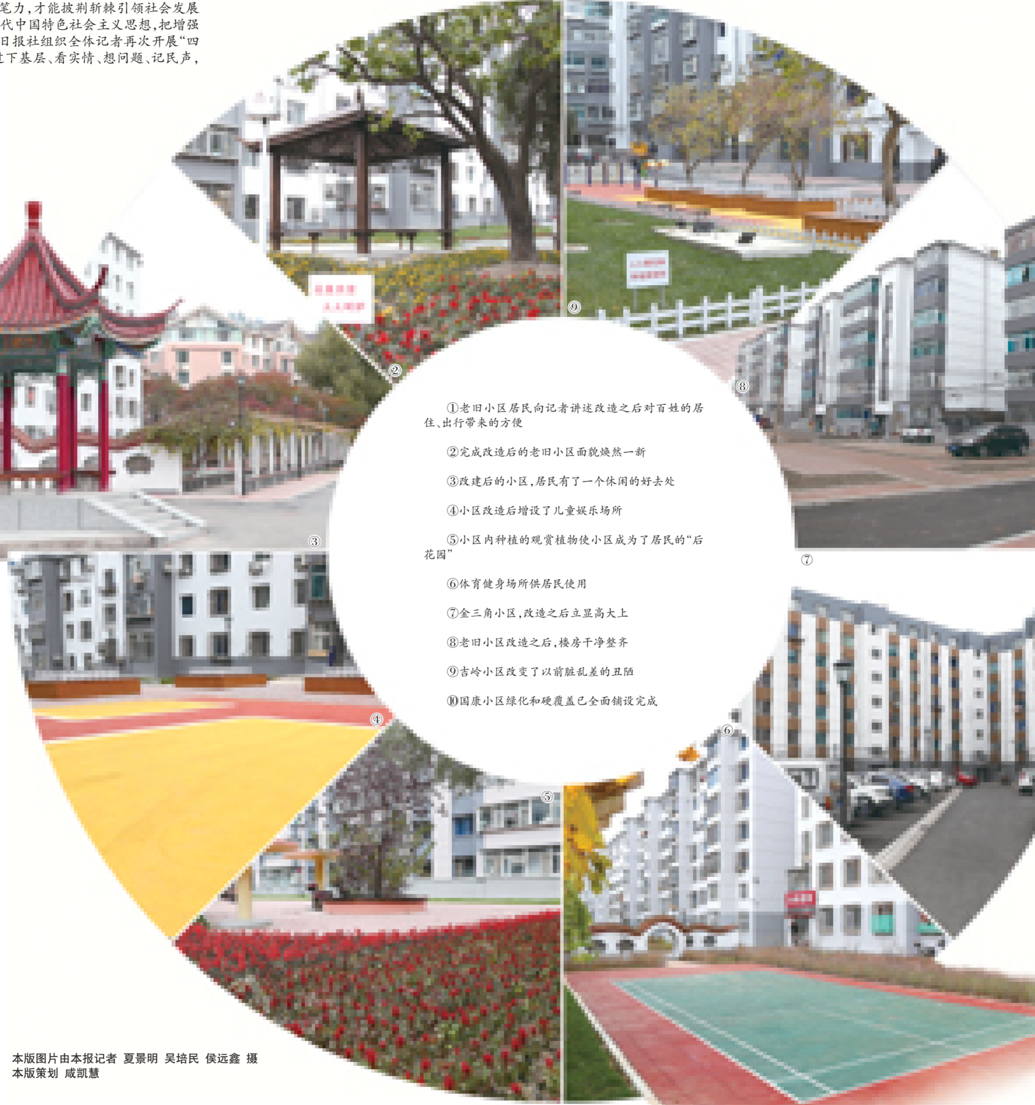
本版策划 戚凯慧