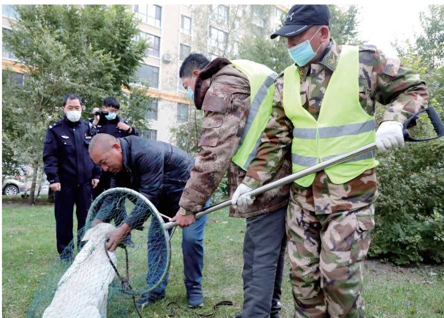
执法部门全面排查,深入治理,提升文明养犬行为。

市公安局提醒广大市民:发现不文明养犬行为可拨打110进行举报;在公共场所发现养犬影响环境卫生行为,可拨打0437-3128011向城市管理综合行政执法支队举报;如有发现动物诊疗机构有违法违规行为,可拨打0437-3297030向动物卫生监督所举报。