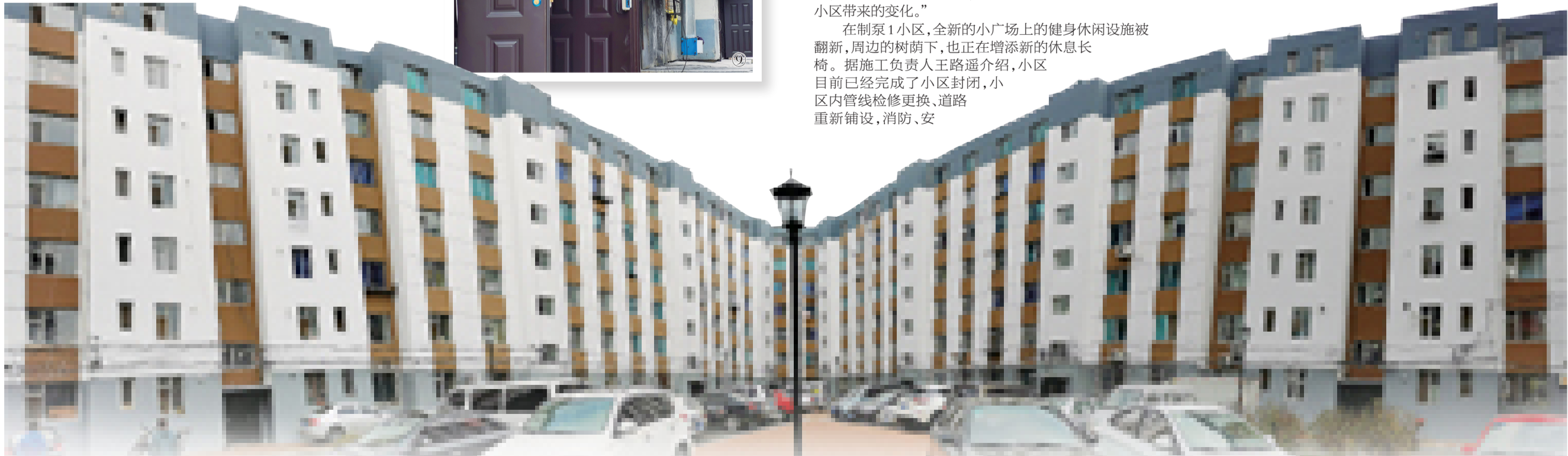
“金三角”小区:老旧楼房焕然一新,咋看咋漂亮

老旧小区改造通过前期摸底调查和宣传工作,多方探索改造模式,先行先试,确定改造试点、统筹规划、同步实施、多部门合同协作,施工单位保质保量赶进度,共同为市民营造良好宜居的生活环境。