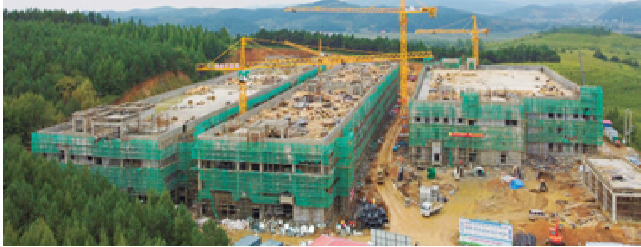
位于东辽县安恕镇的吉林双天生态农业有限公司项目建设现场。

9月下旬,全省2020年“三早”项目启动秋季踏察。9月29日,副省长韩福春到我市,实地察看施工组织、推进力度、建设进展,并听取相关工作汇报。