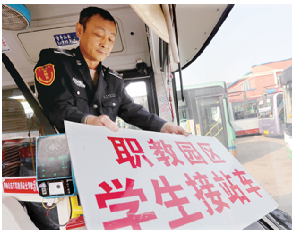
为给南部新城职教园区各院校大学新生入校提供便捷的公交乘车服务,10月11日,市公共汽车公司对6路公交车安装了乘车提示牌。同时将运营结束时间由原来的17时30分延长至18时40分。