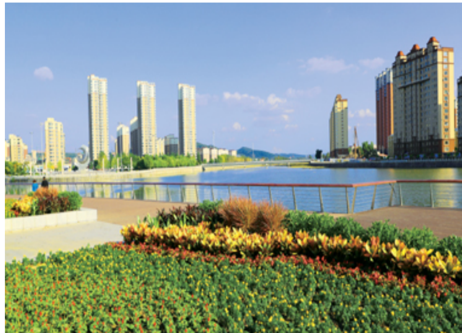
现今,东辽河水面清澈,两岸干净整洁,已成为市民休闲、游玩、健身的好去处。