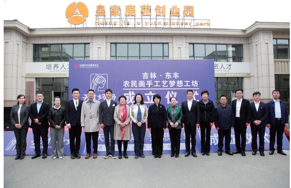
10月11日,“天才妈妈”吉林·东丰农民画手工艺术梦想工坊成立仪式在东丰县“皇家鹿苑”创业园举行。

中国艺术研究院教授、大使张晓龙,中央美术学院城市设计学院副院长、教授郝凝辉在仪式上分别发言;中央广播电视总台《社区英雄》摄制组,北京艾华盛典文化传播公司记者团队,东丰县委、县政府相关领导和市妇联负责人参加活动。