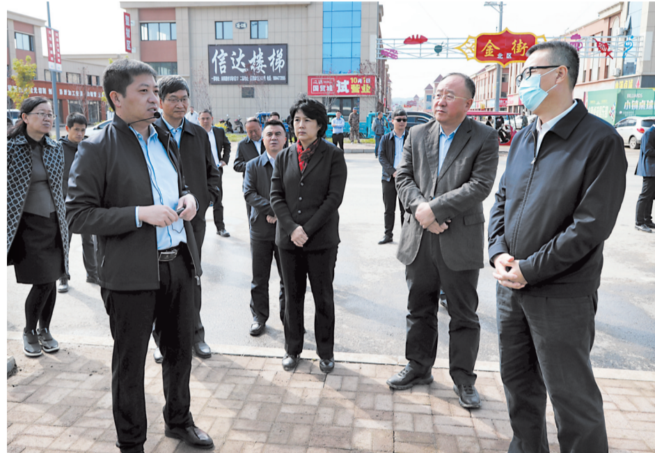
9月29日,副省长韩福春一行到我市就项目建设进行秋季检查。图为韩福春(右一)在辽源汽贸小镇检查相关情况。本报记者 夏景明 摄

本报讯(记者王茵)9月29日,按照2020年全省“三早”行动方案要求,副省长韩福春率省政府副秘书长邱鹏、省住建厅厅长孙志志一行到我市,就项目建设进行秋季检查。市领导柴伟、孙弘、蔡宏伟、胡永为、吴波参加检查。