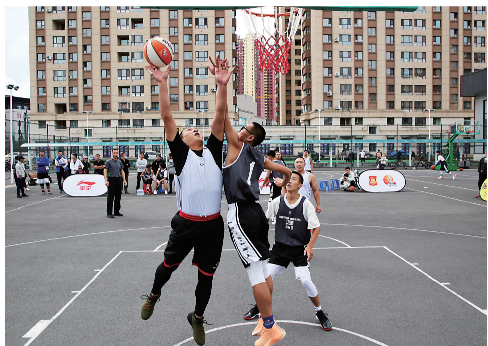
第二届辽源城市节系列活动3V3篮球对抗赛日前在全民健身中心室外篮球场正式开赛。本次比赛共有12支队伍72名队员参加比赛,分为小组赛和决赛两个阶段。图为参赛队伍在进行小组比赛。