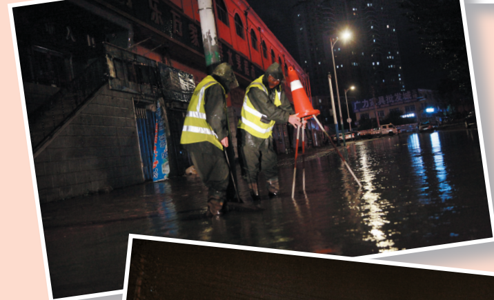
水务集团工作人员及时对低洼积水路段进行排水作业,并设立警示标识。