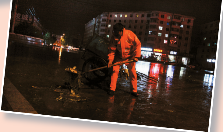
淤泥及杂物进行及时清理。环卫工人对雨后路面