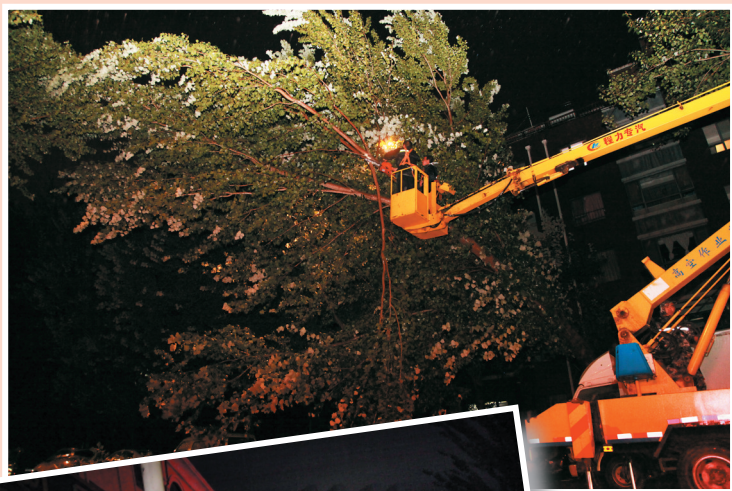
时应对倒伏树木进行清理。市园林处出动高空作业车及