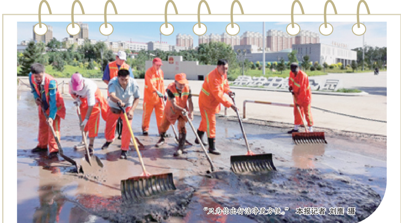
“只为你出行稍凉爽方便。”

本报讯(记者 张莹莹)8月18日下午,我市迎来强降雨天气,经过连续几个昼夜的奋战,城区主干路保洁清淤工作也在紧张忙碌作业中。