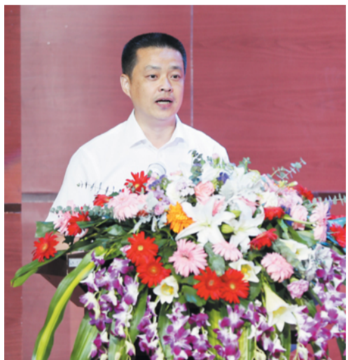
外的武汉。风雨同舟,戮力同心。辽源医疗队分驻武汉的华中科技大学附属同济医院中法新城

院区和武汉雷神山两家医院,在最危险的防疫阵地上昼夜拼搏。50多天里,他们以异乡为故乡、视病人为亲人,用尽全力救治每一位患者。