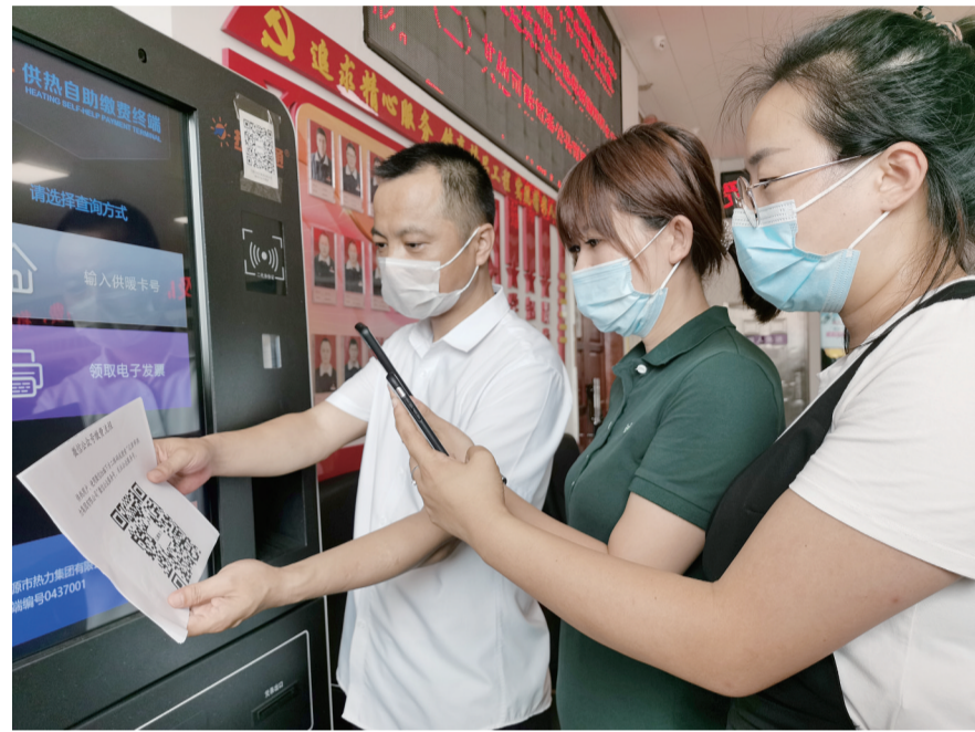
扫码即可办理取暖费缴纳业务及发票打印。

自动缴费终端”打印电子发票,也可以将电子发票下载到邮箱中,通过打印机打印发票。”