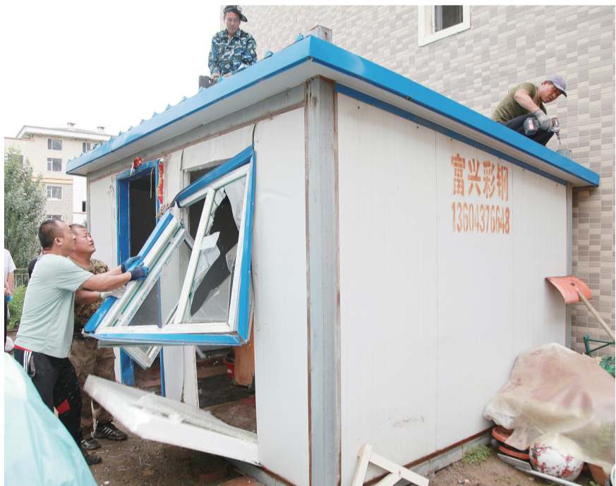
辽河半岛小区内的违建彩钢房被拆除。