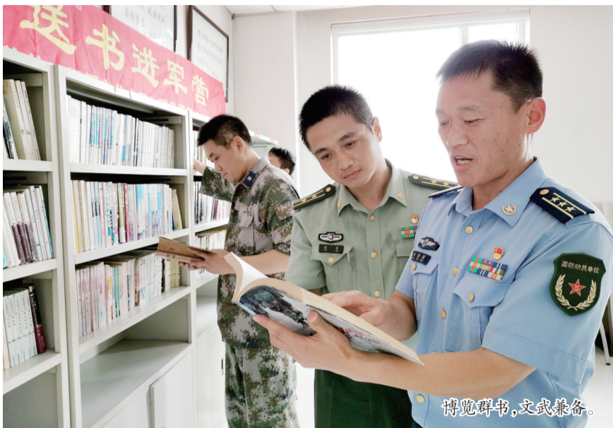
博览群书,文武兼备。

龙山区人武部负责人表示,“送书进军营”活动不仅为增长官兵知识、丰富业余生活、缓解工作压力营造了良好的学习生活氛围,同时也为军人的工作和训练提供了源源不断的精神动力。