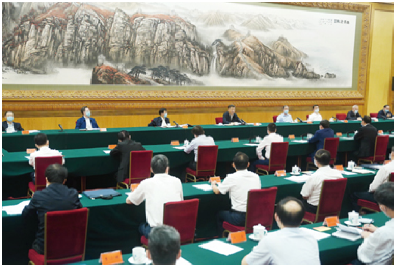
7月21日,中共中央总书记、国家主席、中央军委主席习近平在京主持召开企业家座谈会并发表重要讲话。

习近平指出,市场主体是我国经济活动的主要参与者、就业机会的主要提供者、技术进步的主要推动者,在国家发展中发挥着十分重要的作用。新冠肺炎疫情发生以来,在各级党委和政府领导下,各类市场主体积极参与应对疫情的斗争,团结协作、攻坚克难、奋力自救,同时为疫情防控提供了有力物质支撑。习近平向广大国有企业、民营企业、外资企业、港澳台