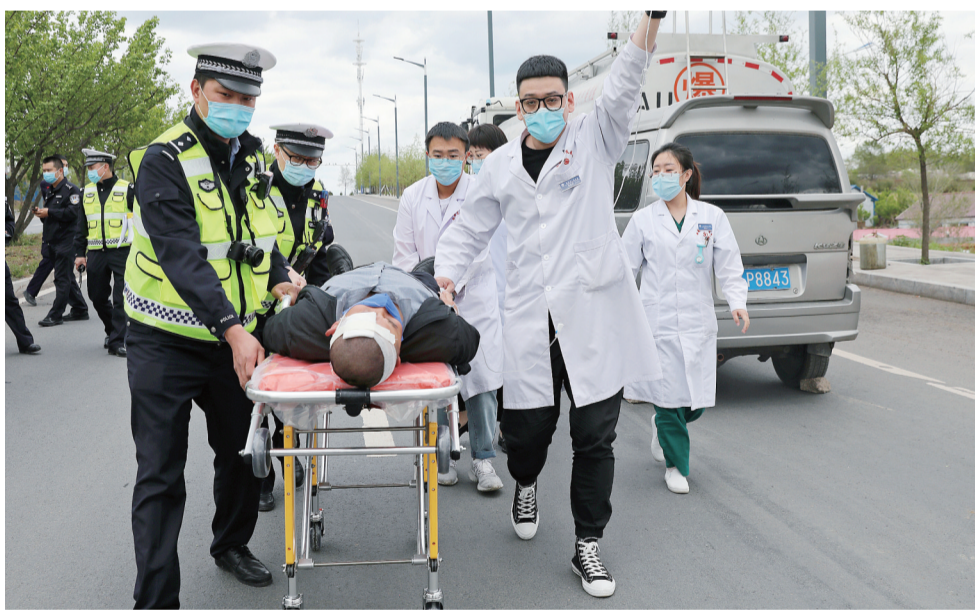
救援演练中,多部门联合参演,凸显“事故救援、生命为先”处置理念。

的执行能力,进一步完善了我市道路交通事故应急救援机制,为保障人民群众生命财产安全夯实基础。