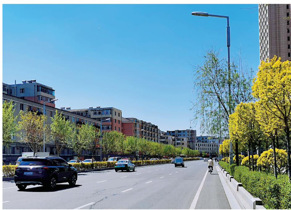
随着全市街路、地下管网及绿化工程建设的深入推进,一个更加环保、有序、干净、整洁的宜居环境正逐步融入百姓的日常生活中。图为沐浴在阳光下的人民大街景色宜人。

随着全市街路、地下管网及绿化工程建设的深入推进,一个更加环保、有序、干净、整洁的宜居环境正逐步融入百姓的日常生活中。图为沐浴在阳光下的人民大街景色宜人。