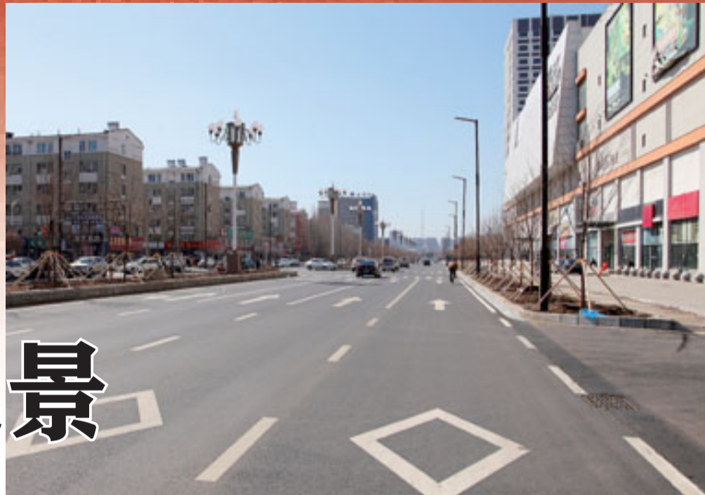
新建的仙城大街双向八车道

如今,改造后的道路宽阔整洁,和以往的路形成了鲜明对比。很多市民纷纷表示:道路升级改造是为老百姓谋福利的大好事儿。路修好了,给大家带来了实惠。路宽敞了,开车、行走的时候心也敞亮了。