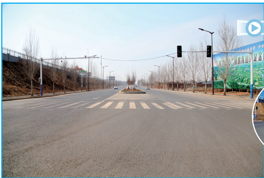
泰安大路凯旋王国路口

本版稿件由本报记者 祝琪尧 采写 本版策划 咸凯慧