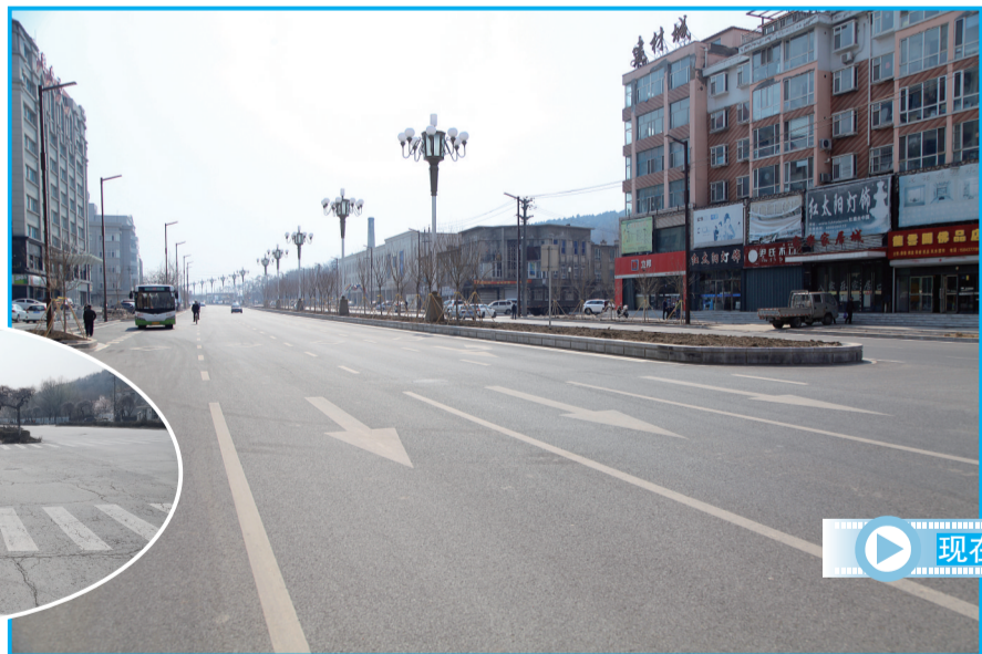
南出口人民大街向阳路段

现在的西宁大路,让沿街的商户和过往的路人都倍感高兴。看着路面上的车辆井然有序、畅通无阻地通行。我们更加相信随着城市的建设,人们的生活一定会越来越便利。