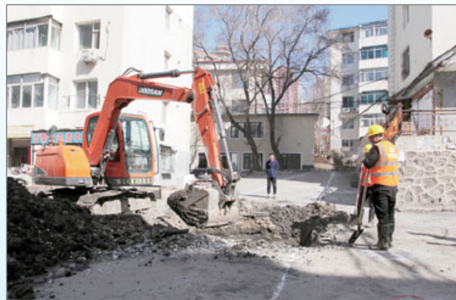
图①:3月25日,北寿小区施工人员正在备料。该小区从3月12日开始实施改造施工,目前,该小区的封闭铁艺栅栏安装已经完成。