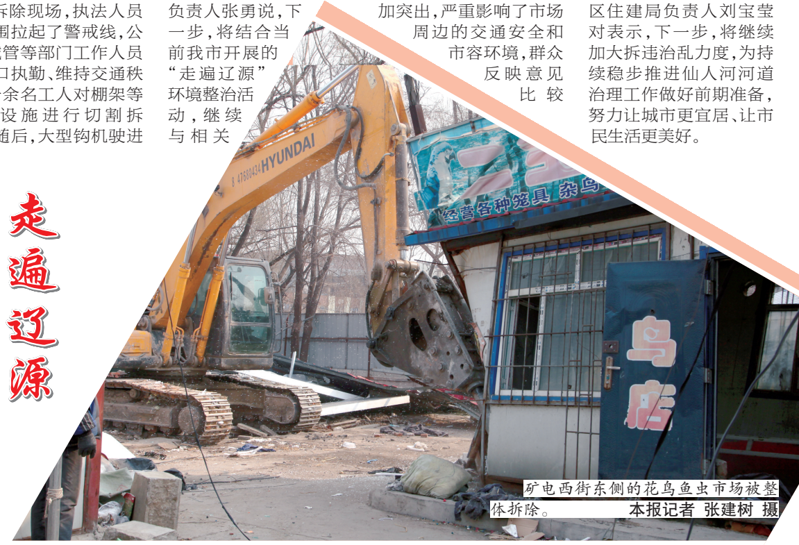
矿电西街东侧的花鸟鱼虫市场被整体拆除。