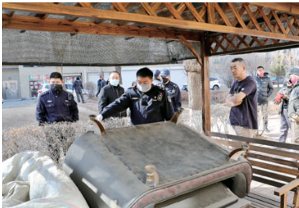
为提高居民居住环境质量,3月22日,龙山区福镇社区对辖区内辽河半岛小区进行环境整治,依法拆除违建和清理乱堆乱放杂物18处,受到居民群众一致好评。

保护好自己和家人的健康。 辽源市新型冠状病毒肺炎疫情防控工作领导小组办公室 2020年3月26日