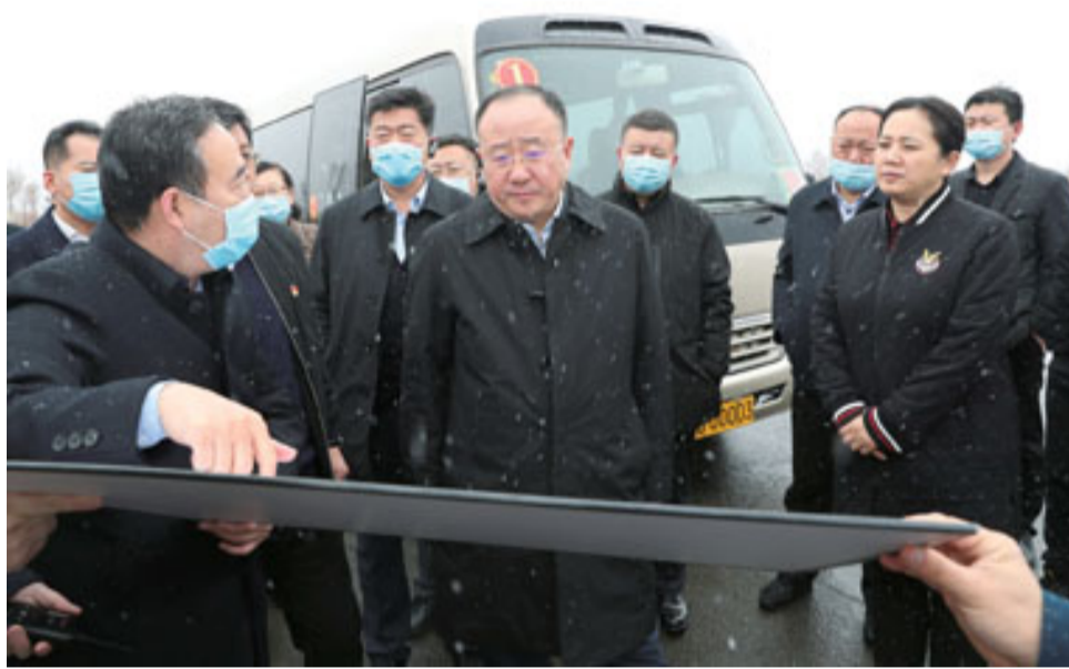
3月26日,市委书记柴伟深入南部新城调研。图为柴伟在第五中学选址地块了解相关情况。本报记者 夏景明 摄

对南部新城开发建设办公室围绕项目自我加压、主动作为的做法,柴伟给予充分肯定。他指出,南部新城