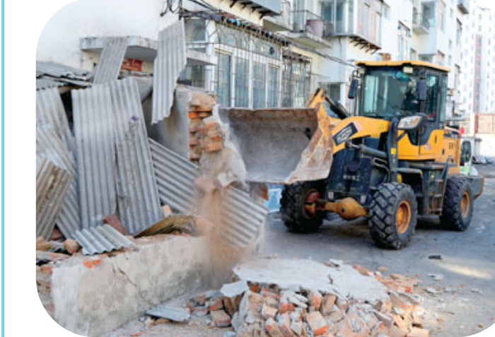
电业小区内违建被依法拆除。