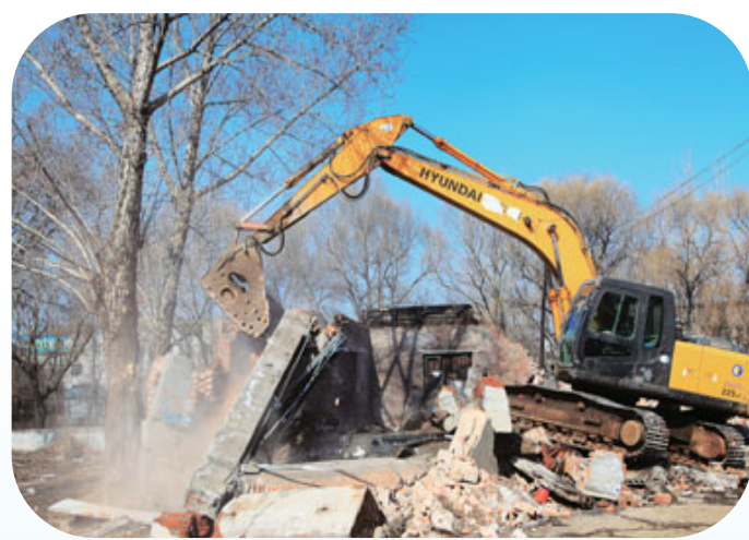
执法人员对仙人河东段河堤上的违法、违规建筑物进行依法拆除。

此次拆除行动,共出动执法作业人员50余人、执法车辆20余辆、大型设备3台,依法拆除建筑物14处、面积约1000平方米。 市城市管理综合行政执法支队西安区大队中队长李宗霖告诉记者,“根据市委、市政府对仙人河两侧整治工作的要求,此次行动,多部门工作人员密切配合、全程参与,对仙人河两侧部分违章建筑物进行依法拆除,整个行动过程有序且顺利,为给辖区百姓营造一个美好的生活环境、打造宜居城市助力。”