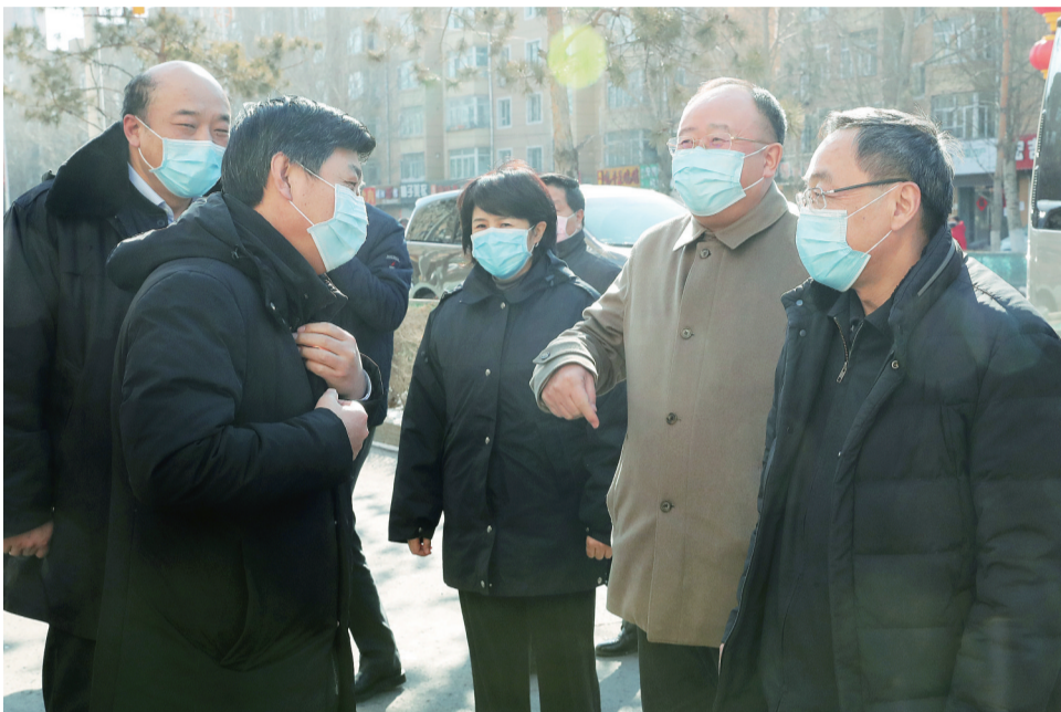
2月18日,副省长侯淅珉到我市督导检查疫情防控和复工复产工作情况。图为侯淅珉在滨河苑小区了解相关情况。

本报讯(记者 王茵)2月18日上午,副省长侯淅珉到我市,督导检查疫情防控和复工复产工作情况。他强调,要坚持加强疫情精准防控,有力有序推进企业复工复产,着力维护经济社会秩序、群众生产生活秩序。 市领导柴伟、孙弘、徐晖、吴波参加督导检查。 在长辽高速公路,侯淅珉与卡口工作人员沟通交流,询问外籍车辆、人员排查检查情况,要求相关部门加大工作力度,合理规划本省籍车辆和外籍车辆通道,安排值守人员适当加以引导,既要守好“防输入”第一道关口,又要保障交通畅通,保障防疫及生活急需物资运输安全、高效、顺畅。 在滨河苑小区,侯淅珉一行详细了解小区居民人数、外返人员排查登记情况、日常防控措施落实情况等。他强调,要进一步强化社区、县乡、村屯疫情防控工作力度,紧盯春节、元宵节、复工复产三个节点外地