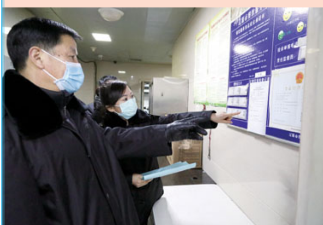
市食品化妆品稽查局工作人员正在检查县医院食堂内设备、设施的卫生条件。

本报讯(记者 赵强)“禁止在食堂内扎堆打饭、就餐,实行分餐制。”“保持空气流通,及时对设备设施、场所地面等进行消毒。”2月3日上午,在辽源市人民医院职工食堂内,市食品化妆品稽查局执法人员一边仔细查验《场所消毒记录》《从业人员晨检记录》,一边叮嘱该医院食堂食品安全管理人员,要严格落实各项防控要求,坚决防止疫情传播。检查结束后,执法人员针对检查发现的问题,提出相关整改意见。