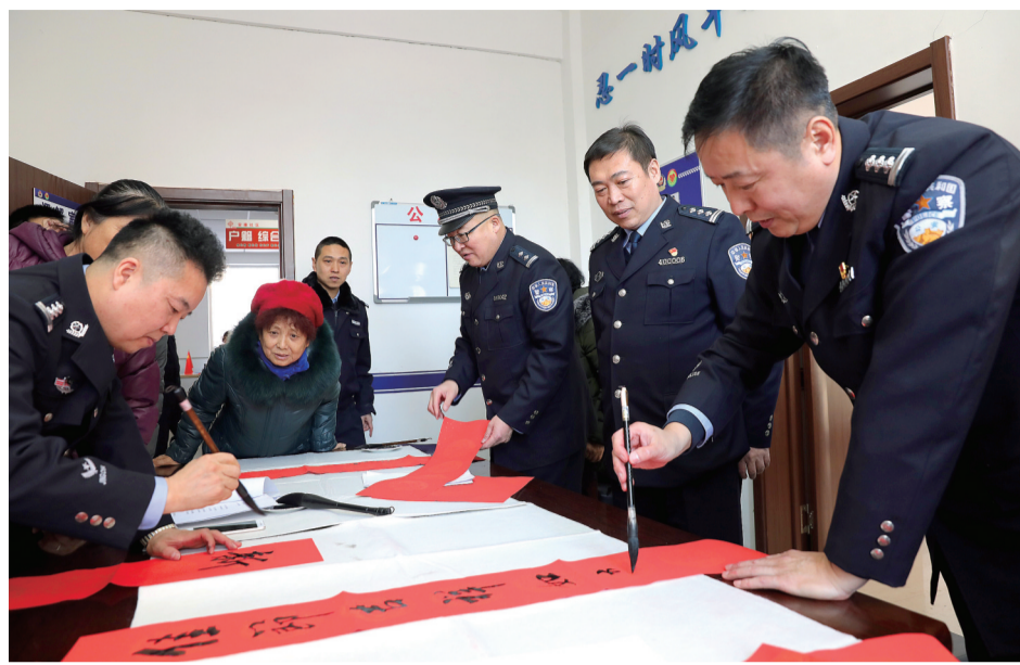
一副副寓意吉祥的大红春联,将警民和谐构建得更加牢固。