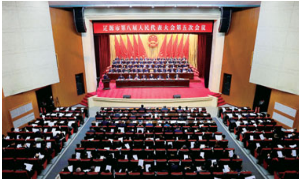
1月7日,辽源市第八届人民代表大会第五次会议在龙山礼堂隆重开幕。