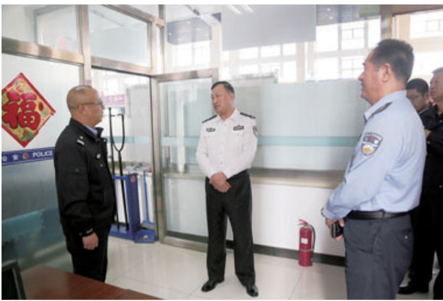
市局领导带头深入基层进行调研