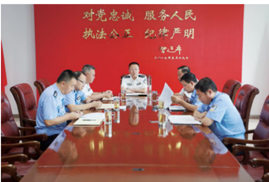
市公安局召开党委研究会主题教育工作

全市“不忘初心、牢记使命”主题教育开展以来,市公安局严格落实中央、省委和市委主题教育部署要求,紧紧抓住“守初心、担使命,找差距、抓落实”总要求,围绕根本任务和具体目标,坚持把主题教育和全市公安工作紧密结合,深入学习贯彻习近平新时代中国特色社会主义思想,抓实学习教育、调查研究、检视问题、整改落实四项重点措施,确保思想认识到位、检视问题到位、整改落实到位、组织领导到位,教育引导各级党组织和全体党员以最好状态、最强担当、最实举措推动主题教育真正往心里走、往深里走、往实里走,以实际行动践“初心”担“使命”,让人民群众有更多、更直接、更实在的获得感、幸福感和安全感。