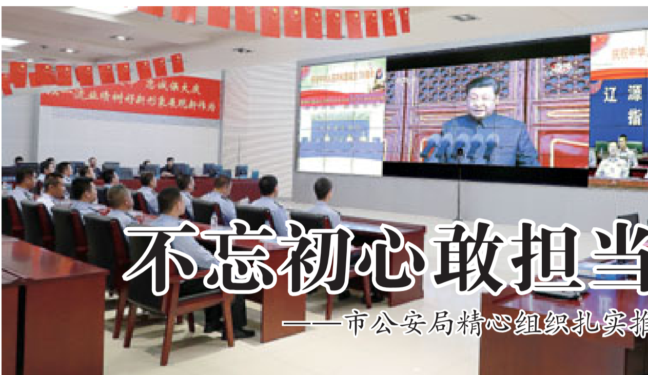
集体观看庆祝新中国成立70周年大会