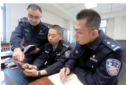
民警多种形式进行学习