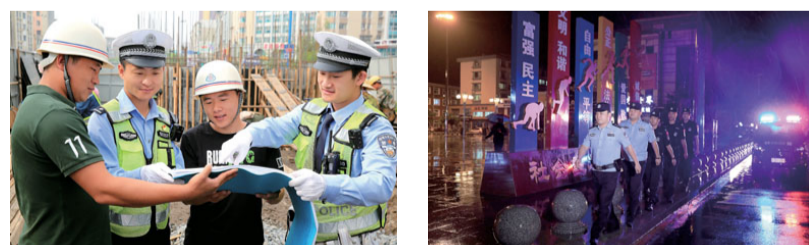
服务全市高质量转型发展

最安全地区的责任担当,坚持立查立改、即知即改。按照全市开展专项整治工作部署和要求,列出30个查摆重点,制定41项整改措施,做到整改有目标、推进有措施、落实有责任、完成有时限,做到问题不解决不松劲、解决不彻底不放手;紧盯公安队伍建设实际,强化政治建警、从严治警,推动共性问题与个性问题一项一项销号解决,确保主题教育取得实实在在的成效。