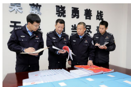
市局主题教育办公室深入基层督导检查