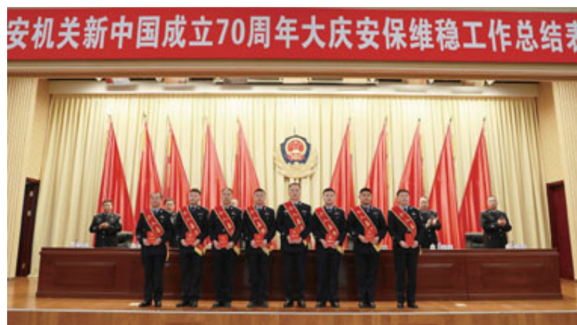
圆满完成新中国成立70周年大庆安保维稳工作任务

“四个自信”、做到“两个维护”的实际行动,转化为做好公安工作的强大动力,用公安事业发展新成果彰显主题教育的新成效,为全市高质量转型发展营造安全稳定的社会环境。辽源公安将坚定不移地以习近平新时代中国特色社会主义思想为指引,更加自觉地把人民群众置于最高位置,把为民造福放在心上,担当尽责护安全,主动出击保民生,坚持和发展好新时代枫桥经验,努力为全市人民提供更方便、更优质的公共服务,创建全国最安全地区,不断创造无愧于时代、无愧于人民的新业绩!