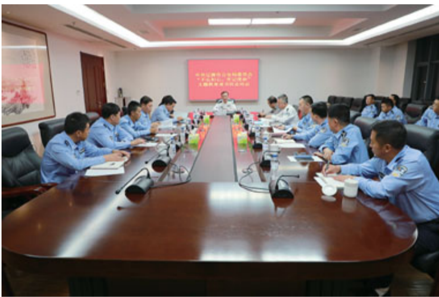
市局召开“不忘初心、牢记使命”主题教育读书班总结会