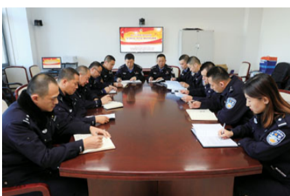
基层党组织召开对照党章党规找差距专题会议