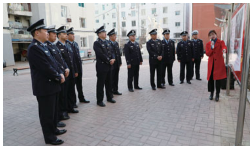
开展革命传统教育

义教育和廉政警示教育。9月20日,市局组织60余名党组织书记和委员开展了基层党组织书记培训,重点学习了习近平新时代中国特色社会主义思想和党中央关于“不忘初心、牢记使命”主题教育的部署要求,切实提高了基层党组织书记抓主题教育的思想自觉、政治自觉和行动自觉。市局各基层党组织聚焦学习贯彻习近平总书记“不忘初心、牢记使命”重要论述,组织党员民警深入开展自学和学习讨论活动。通过系统学习,进一步增强了党员民警“守初心、担使命”的责任感和使命感,进一步夯实了增强“四个意识”,坚定“四个自信”,做到“两个维护”的思想根基。