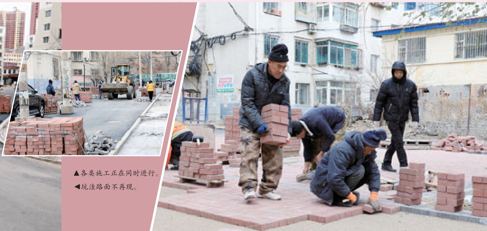
▲各类施工正在同时进行。 ◀坑洼路面不再现。