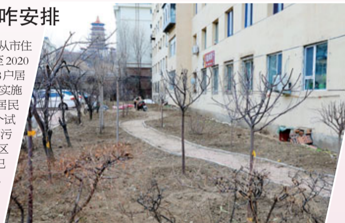
“小片荒”成了景观带。

关于老旧小区改造进度安排,记者从市住建局了解到,2019年谋划在2019年至2020年将对我市15个小区、192栋楼房、10448户居民、建筑面积64.54万平方米的老旧小区实施改造。按照先行先试原则,在充分征求居民的前提下,确定了教师新村、安居小区两个试点小区先行改造工作。目前,教师新村雨污分流、道路铺设、绿化工作已完成;安居小区雨污分流及主路、部分人行步道铺设工作已完成,预计本月末可完成整体铺设。2020年,在先行先试形成的可复制、可推广经验的基础上,全面推开计划内老旧小区改造工作。