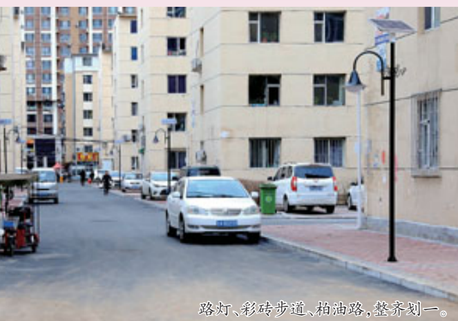
路灯、彩砖步道、柏油路,整齐划一。