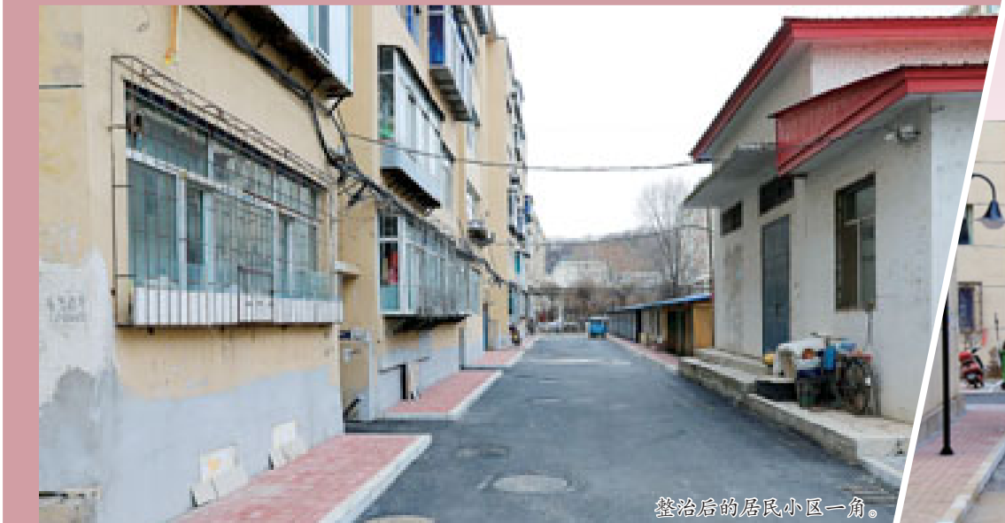
整治后的居民小区一角。

安装的路灯与监控,还有新种树木。小区内的违章建筑经过多部门的综合执法已经被拆除,让小区更干净、更整洁。其实,老旧小区的改造并不仅仅在硬件方面进行改造升级给老旧小区的路面硬化、安装路灯和监控,而且还对小区其他方面进行综合改造升级,目的就是让老旧小区居住质量有一个大的提升,不断提高广大居民的幸福指数。