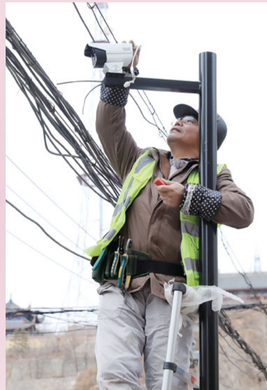
小区视频监控将实现全覆盖。

根据市委、市政府要求,市住建局已经开始有针对性的对老旧小区进行改造。由于老旧小区改造项目工程量较大,涉及面积及户数较多,市住建局进一步对改造项目进行统筹安排,制定了以下工作措施,确保持续推进我市老旧小区改造工作,真正做到好事办好、实事办实。进一步强化领导。成立以市住建局主要负责同志为组长的专项工作小组,工作层层落实到人头,明确工作责任;因地制宜抓改造。实地踏查各个小区,根据每个小区不同的特点,设计出最完善的改造计划;进一步调动各方力量,协调各相关部门,按照各部门职责对小区内影响改造的构筑物、建筑物等进行拆除,保障工程顺利进行;进一步强化老旧小区管理工作,对进行改造的无物业管理的小区进行统筹规划,协调老旧小区居民进入物业服务时代,做好后期管理工作,以保证此次改造后,小区内物业形成常态管理,延长公共设备、设施使用寿命。