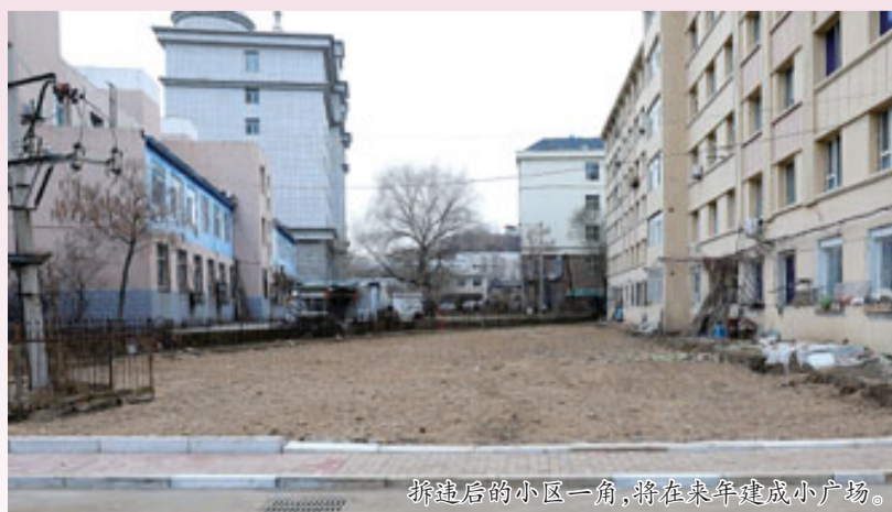
拆建后的小区一角,将在来年建成小广场。