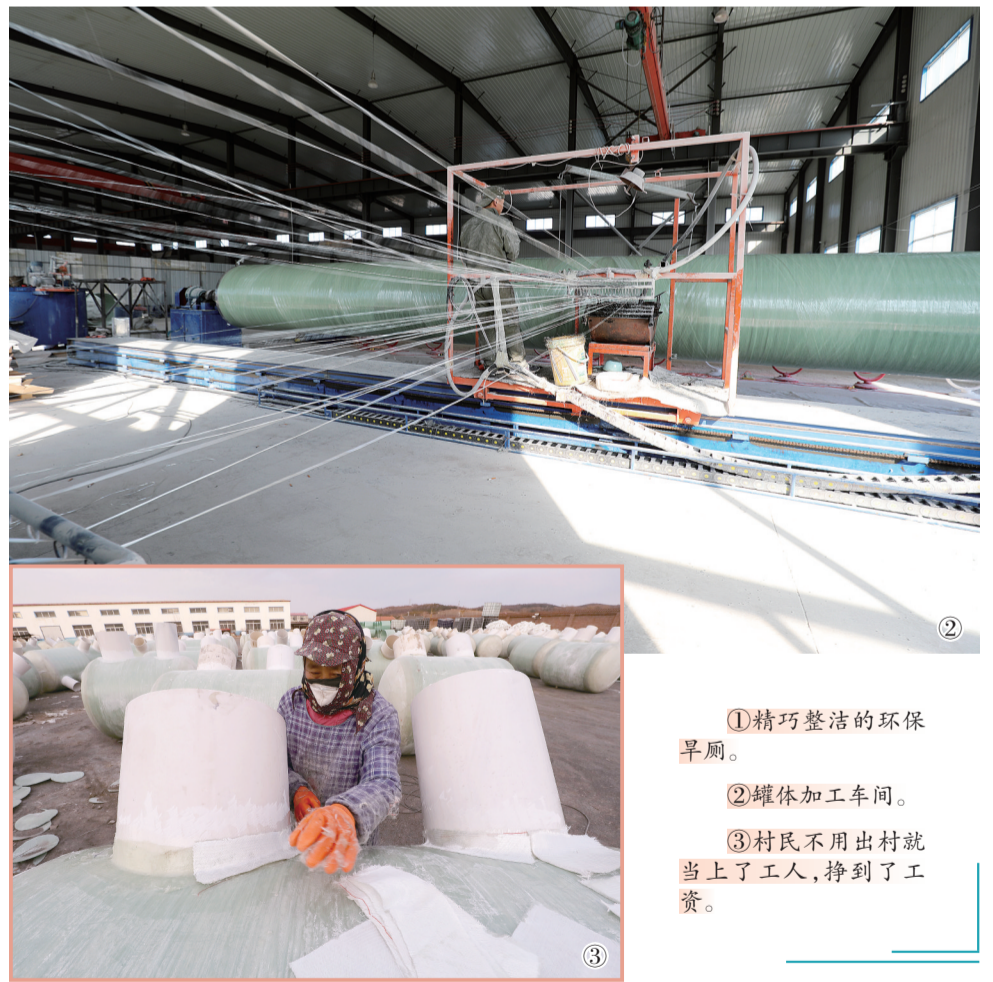
①精巧整洁的环保早厕。 ②罐体加工车间。 ③村民不用出村就当上了工人,挣到了工资。

冻,能保证农户正常使用。造价仅需3000多元,而市场上同类产品却高达五六千元以上。现在俺们公司的订单像雪片似的。”柏洪斌一脸自豪地说。永治村党支部书记蒋卫阳对凡是能壮大村集体经济、又能鼓村民腰包的事绝不含糊,向来是既抱西瓜又捡芝麻。在他看来“厕所革命”是改善农村人居环境整治当中的重要角色,同时也是一个千载难逢的商机。打定主意,他自掏腰包率领村干部、合作社相关人员赴浙江、去河北,一路踏察。最终,将生产成本低、质量一流的环保早厕项目引回村里。蒋卫阳透露,环保早厕项目上马后,光永治村本村的村民就多达六七十人成了开月工资的“工人”,有效地转移了农村富余劳动力,这些村民平均月工资都在4000元以上。说这话时,蒋卫阳目光深邃坚定、充满自信。