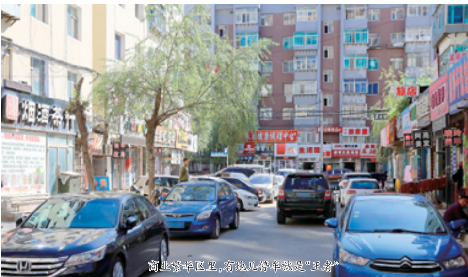
商业繁华区里,有地儿停车就是“王者”