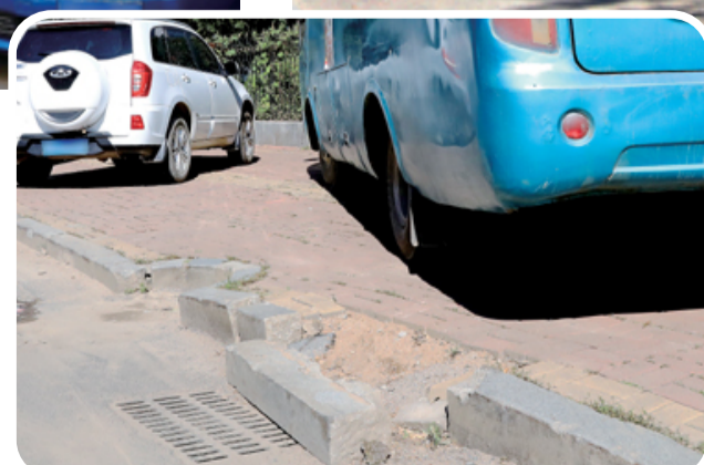
软转轮总比硬边石厉害