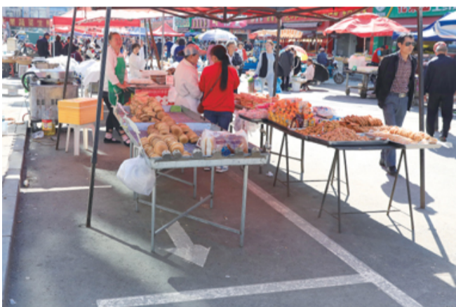
占用停车位经营现象很普遍

每一座城市都是有生命的,当城市正处于飞速发展阶段时,改变无处不在:新的高楼不断崛起,新的道路不断延伸,城市配套设施不断完善……建筑如果是城市的骨骼,交通就是城市的血脉,而生活于其中的人,则是城市真正的生命活力。