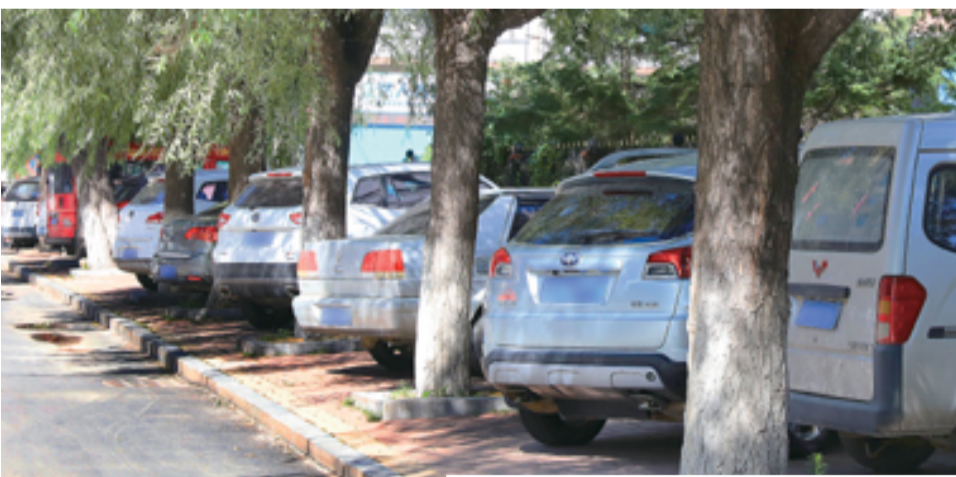
马路边石再高,硬着头皮也得上。