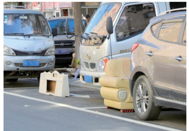
杂物占位已成常态