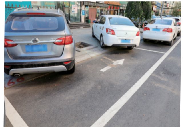
如此停车,“礼让”中带有一份“理解”