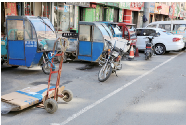
公共停车位“私有化”是否有些“合情合理”