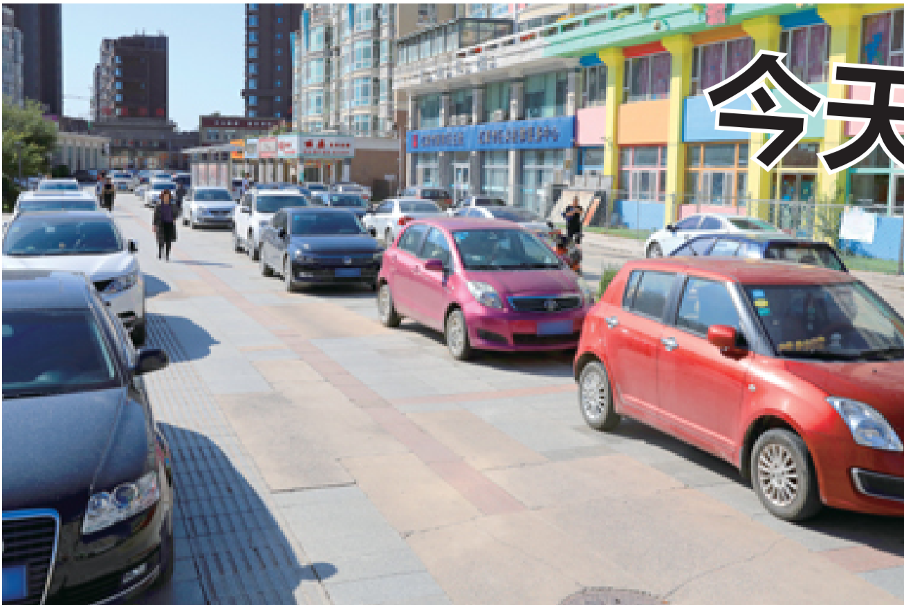
自律停车使小区环境“紧上加紧”