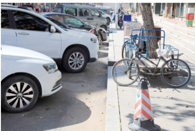
马路边石上下“乱”当先