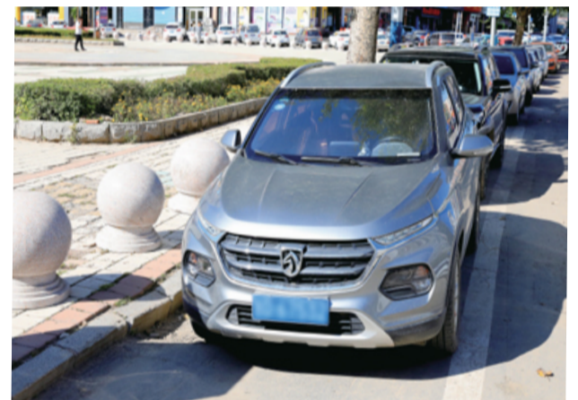
广场内禁停,但沿街违停的“大伙儿”很规整

最近几年辽源市建设的重点工作之一就是改善城市环境,就拿今年开展的轰轰烈烈的修路道路和污水改造工作来说,仅给全市的交通环境带来了压力,也让停车的难题变得更加严重。有时候市民早上出门时小区门前还是一片通途,可能晚上回来就发现被拦上了施工标志。辽源的司机们开车出门时不仅要面临路况的随时变化,同时也要面对施工导致停车位消失,停车位越来越少的窘境。