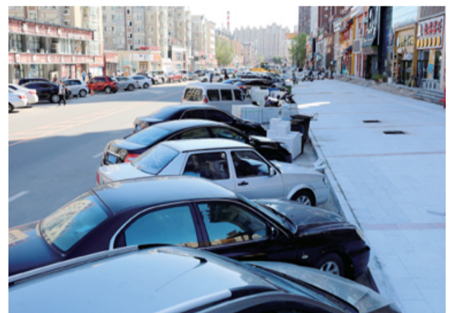
康宁大街与辽河大路交汇处:车轮总比边石扛造