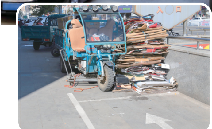
侵占停车位无人管理