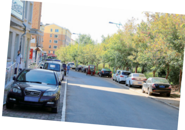
人行步道全部变成“停车位”,人走行车道。

越来越多的家庭拥有私家车,城市交通环境的压力也随之成倍增加。辽源现在也面临着同样的问题:现有的停车位不足以满足市民的需求,而最近的道路整修和水污分离改造工程又让停车难问题更加突出。很多人把车开出家门时,就在思考一个问题——今天,我的车要停在哪里?