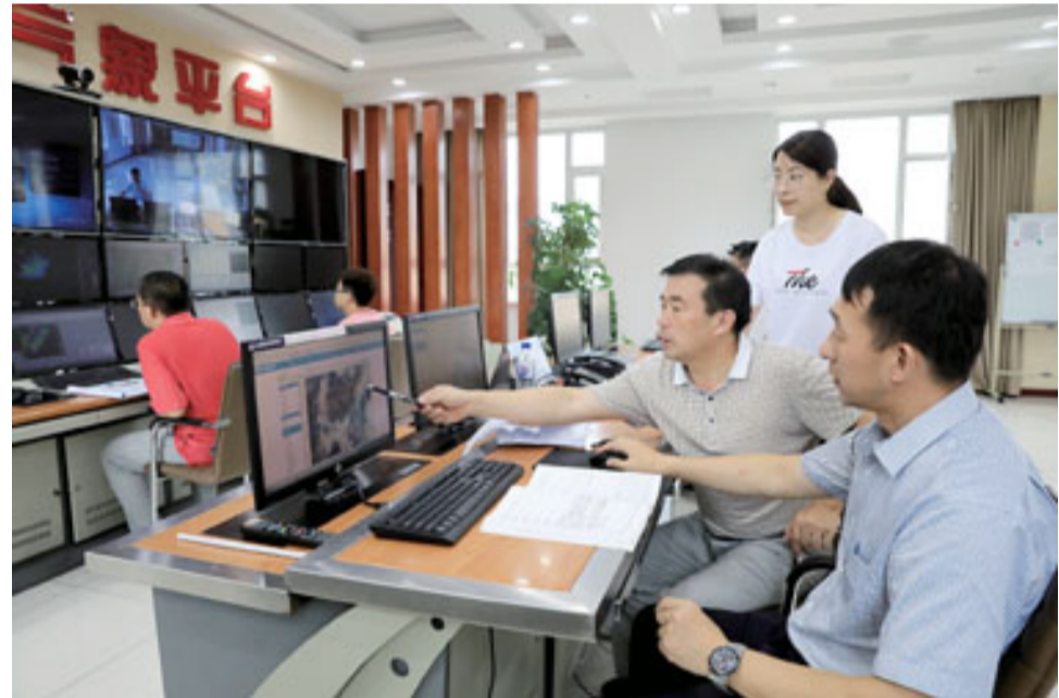
市气象台工作人员全天候监视天气变化情况,全力做好天气预报服务工作。