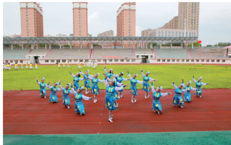
西安区广场舞代表队正在表演。