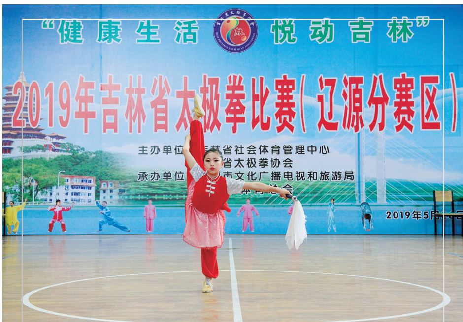
5月26日,由吉林省社会体育管理中心、吉林省太极拳协会主办,市文化广播电视和旅游局、市武术协会承办的“健康生活、悦动吉林”2019年吉林省太极拳比赛(辽源分赛区)在我市体育馆举行。来自全市26支代表队的164名选手参加比赛。图为市武术学校小学员在进行比赛。

活动中,工作人员现场解答了群众有关粮油科普知识等方面的咨询,并发放宣传资料300余份。通过宣传,让广大群众充分了解了粮食科技相关常识,普及粮油鉴别知识,为提升消费者安全和维权意识、牢固树立爱粮节粮意识发挥了积极作用。(筱祺)