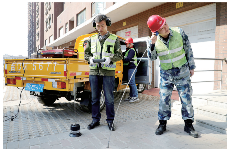
为有效降低漏水损耗,水务集团不断提升除漏测工作科技含量及技术指标,减少自来水管线漏水,消除施工作业面积及施工时,为人民群众生产生活用水提供保障。图为3月11日,工作人员在隆基华典小区内查找漏水点。

本报讯(记者 赵强)为进一步提升我市基层农技推广人员业务素质,助推全市现代农业发展,近日,由农业局、市农业技术推广总站联合举办的辽源市基层农业技术人员培训班开班。来自市、县、乡三级农业技术推广系统的30余名基层农技人员参加培训。 培训中,来自市农业技术推广总站的3位专家结合我市农业现状,为参训人员讲授农业生产基础知识、化肥减量增效技术、试验示范方案的制定与实施,以及中国农技推广手机APP使用等内容。“这次培训举办得十分及时,内容充实,让我学到了新知识,开阔了视野。”来自西安灯塔镇的学员曲俊生说。 市农业技术推广总站相关负责人表示,开展基层农技人员培训,目的是提高基层农技人员业务水平和服务能力,更好地为现代生态农业产业化建设服务,为我市农业人员指导农业生产,加快乡村振兴战略的实施提供强有力的科技和人才支撑。