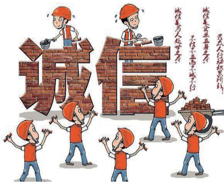
稿件由本报记者 宋建立 采访 本版策划 戚凯慧

企业诚信是整个社会诚信的基础，加强企业诚信建设，提高企业诚信度，对于发展企业生产力，增强企业竞争力，提高企业的经济效益和社会效益，对于保障经济持续健康快速发展，促进社会和谐，具有重大意义，只有大力加强企业诚信建设，才能为企业注入不竭发展动力。